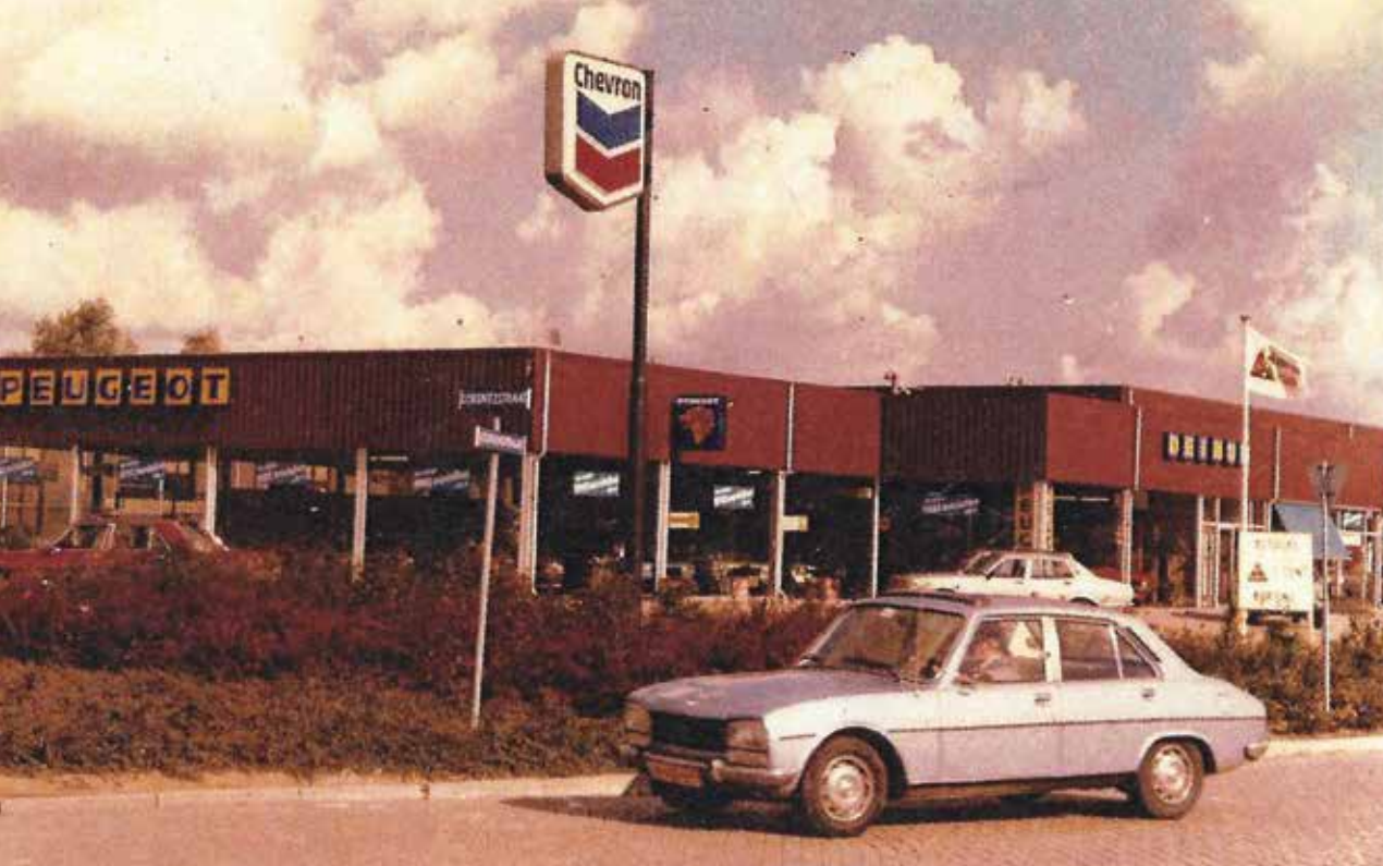
Peugeot dealership Deinum, 1978 tot 1981.