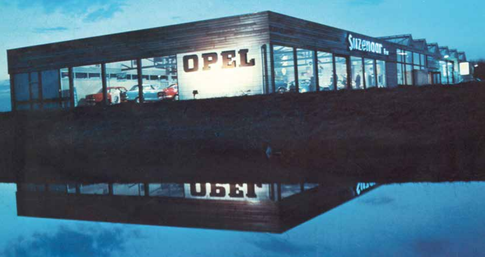
Opel Suzenaar Heerenveen, 1971.