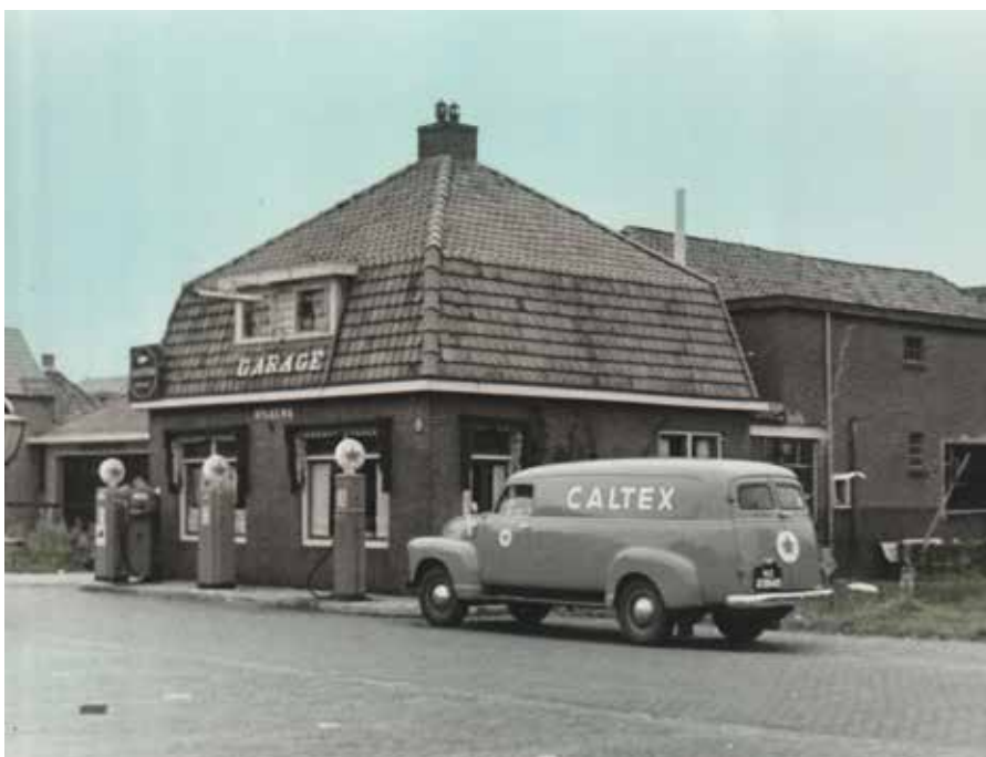
Hylkema aan de Marktweg in Gorredijk, 1946.