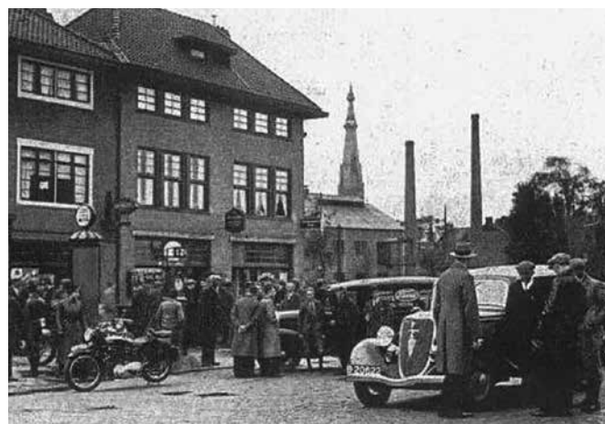
Hotel de Bleek en het pand op de Groningerstraatweg (in Leeuwarden), waar garage Engelsma & Wijnia in 1956 gevestigd werd. De foto is van omstreeks 1936.