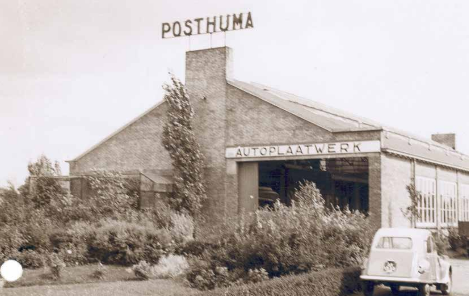
Posthuma carrosseriebedrijf (Autoschade Posthuma), begin periode 1955.