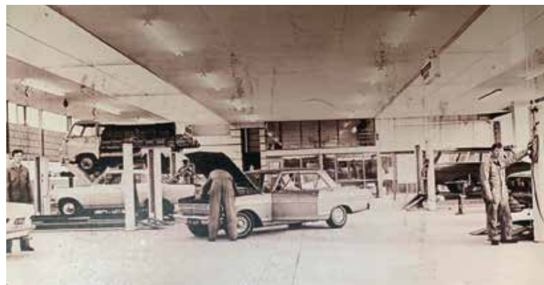
Siton Drachten, ± 1969, nu Haaima Hylkema Opel Drachten.