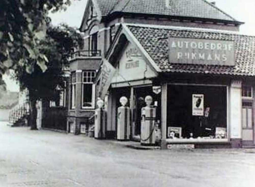
Autobedrijf Rijkmans in Steenwijk, jaartal onbekend.