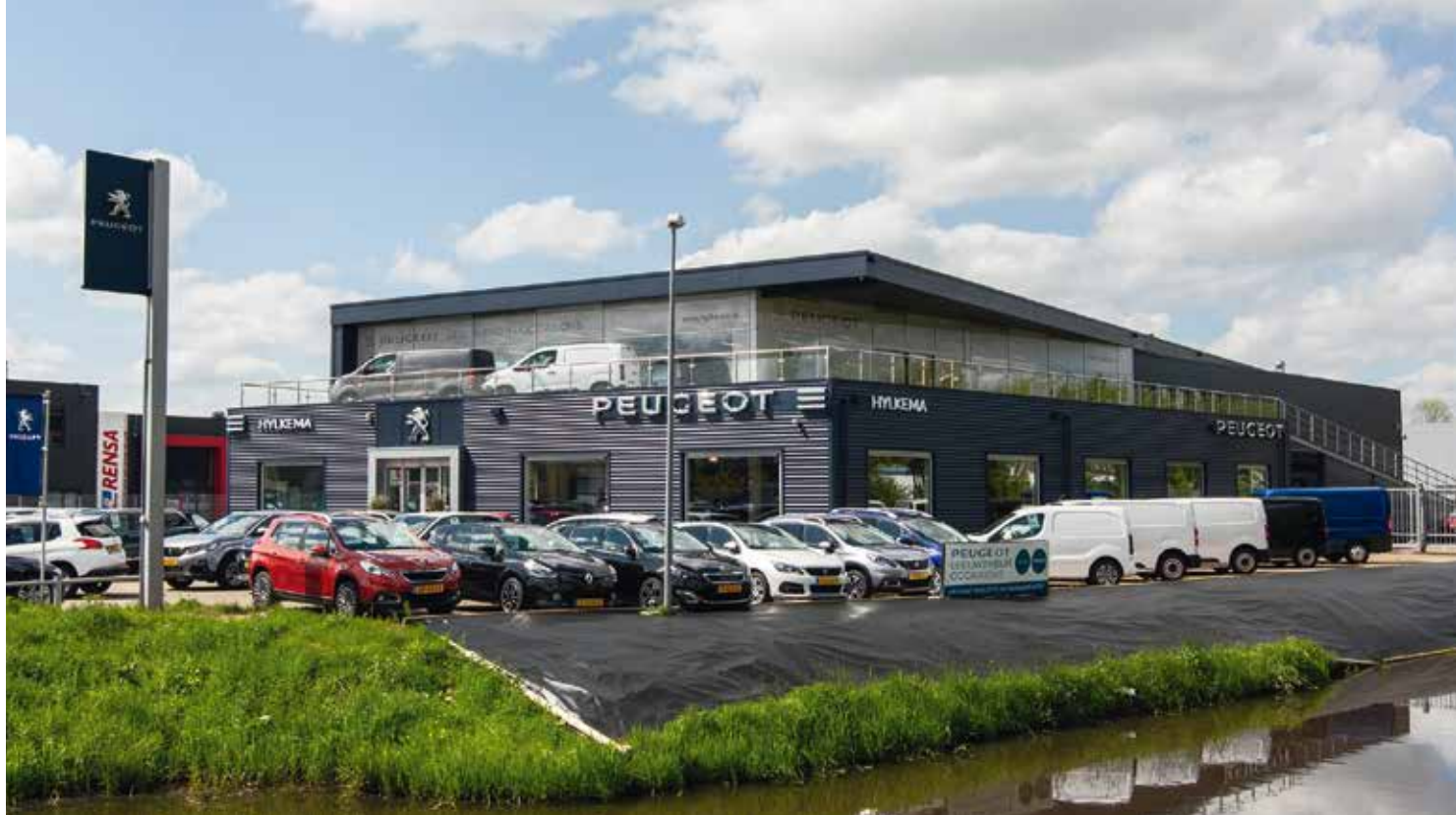
Hylkema Drachten, 2019.

“ Ik heb dan ook alle vertrouwen in de toekomst. ”