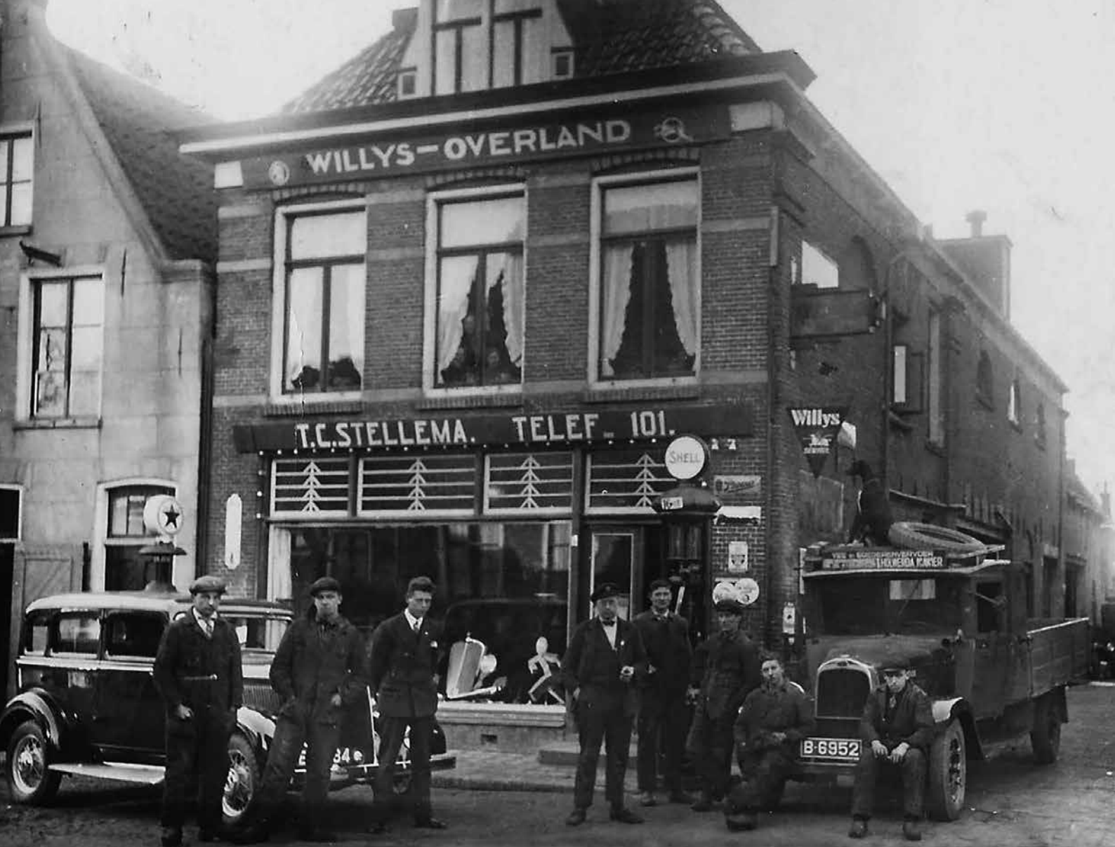
Stellema begon in de jaren twintig in de Dokkumer binnenstad met de verkoop van Amerikaanse auto's.